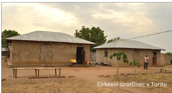
Církevní sirotčinec v Toritu

Biskup episkopální církve Bernard Oringa Balmoi je v současné době klíčovou kontaktní osobou na jihosúdánské straně. Byl to on, kdo při své návštěvě v ČR před několika lety tlumočil prosbu tamní církve o pomoc a podporu z Čech. Je člověkem, které-ho řada z nás osobně zná, je tím, komu důvěřuje církev i státní moc, která jej dokonce pověřila koordinací pomoci uprchlíkům. Biskup je pro nás také zárukou dodržování smluv mezi českou a súdánskou stranou a kontroly účelného vynakládání prostředků (měli jsme možnost si opakovaně ověřit biskupovu spolehlivost). Proto se letos na jaře stala podpora biskupa součástí naší služby. Předané peníze na platy dvou mladých spolupracovníků (William a Betty) umožní provoz biskupovy "kanceláře" (nejde o kancelář v evropském smyslu, spíše o jakýsi pomocný „servisní“ tým jeho nejbližších spolupracovníků či učedníků s cílem biskupovi ulehčit.